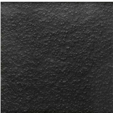
nero brillante brilliant black