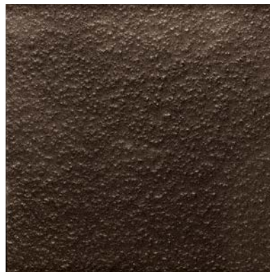
marrone brillante brilliant brown