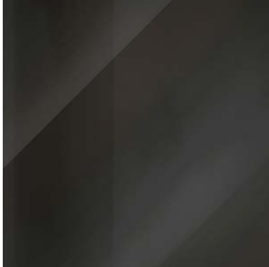
nichel nero lucido black glossy nickel